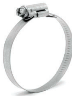
9 mm W1 och W3