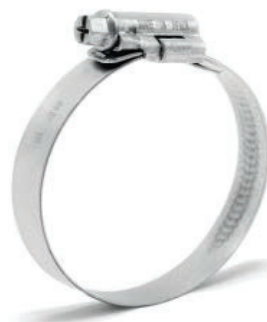
12,2 mm W5